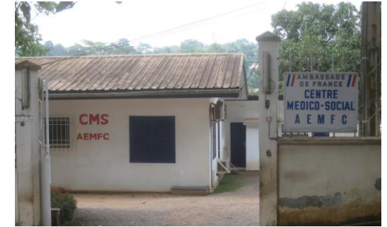
Le Centre Médico-Social de Yaoundé

ASSOCIATION D'ENTRAIDE MEDICALE DES FRANÇAIS DU CAMEROUN